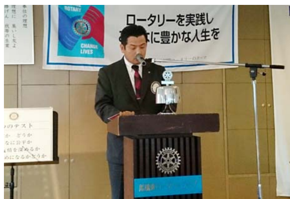
大原会長エレクト 卓話